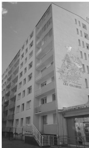
la copropriété "Les Colibris" change de peau avec le soutien du dispositif Mur Mur.

Mur Mur ? C'est le nom du programme d'actions de la Métro pour accompagner financièrement les copropriétés dans leurs travaux d'isolation thermique avec un triple objectif : une action sur l'environnement pour consommer moins d'énergie, un gain de pouvoir d'achat pour les propriétaires et les locataires grâce à une baisse de leur facture énergétique, un soutien à l'emploi et à l'économie locale via la multiplication des chantiers de rénovation.